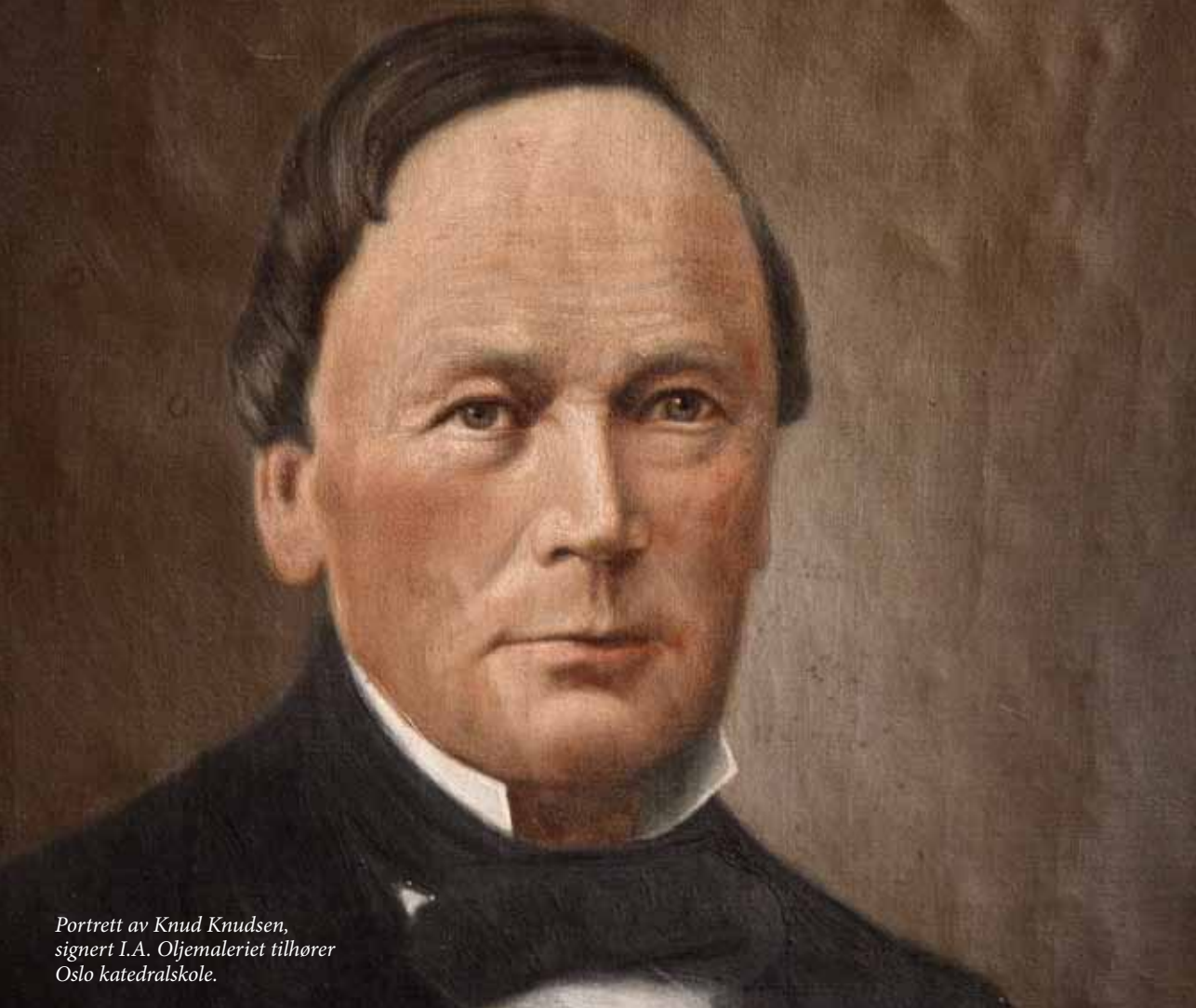
Portrett av Knud Knudsen, signert I.A. Olfemaleriet tilhører Oslo katedralskole.