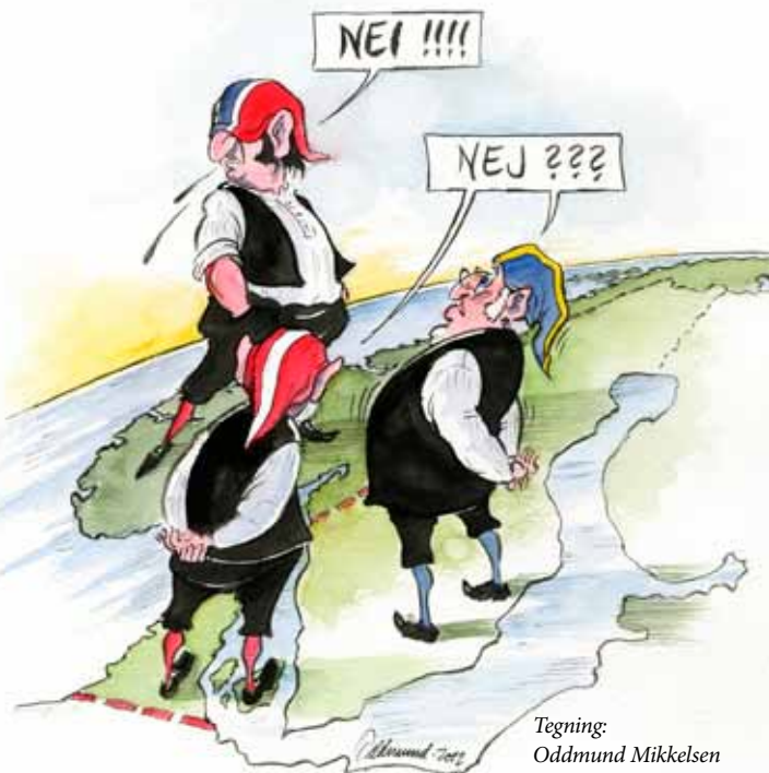
Tegning: Oddmund Mikkelsen

logiene. Knudsen hadde riktignok ingen utopiske ideer om å slå sammen de skandinaviske skriftspråka til ett, men han så alt i artikkelen fra 1845 for seg ei framtid med et eget skriftspråk for Norge til erstatning for dansken.